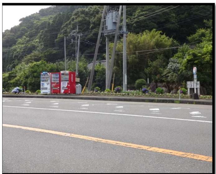
小吹毛井バス停付近