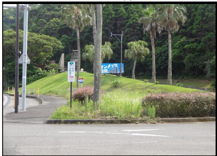
サンメッセ日南入口