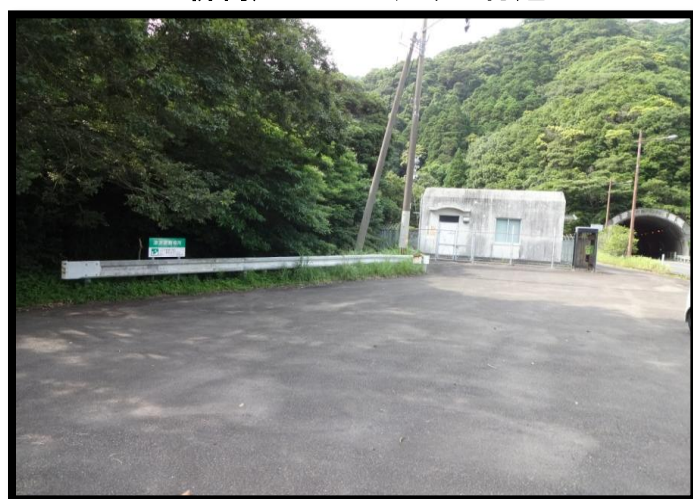
新鶺鴒トンネル入り口付近