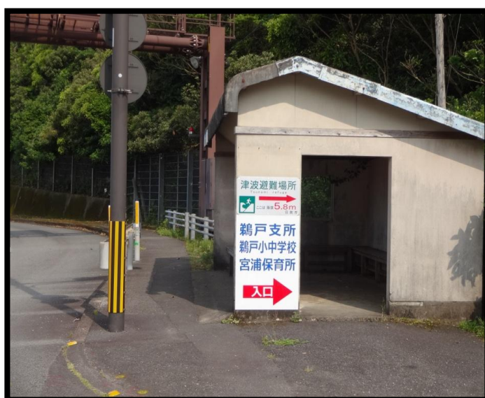
鶺鴒小中学校入口