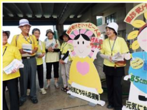
受診率アップキャンペーン