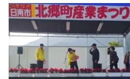
北郷町産業まつり (健康劇「健診受診の巻」を披露)