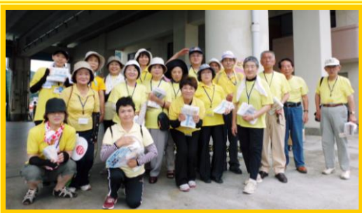
受診率アップ大作戦

元気づくり・仲間づくりをキーワードに、隊員自身と日南市民の元気と健康の輪を広げるための活動を行うことにより、健康で明るい元気な日南のまちづくりを目指しています。