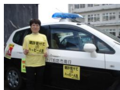
健診受診の呼びかけ