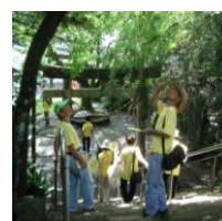
日南のいいところ探し！まち歩き