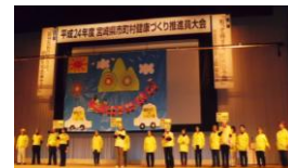
宮崎県市町村健康づくり推進員大会 (H24 シーガイアにて発表)