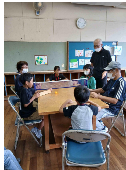
【卓球バレーボール】