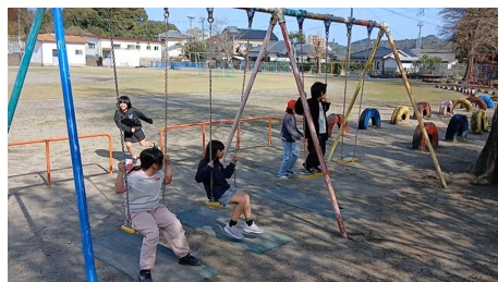
【運動場の遊具で遊ぶ】