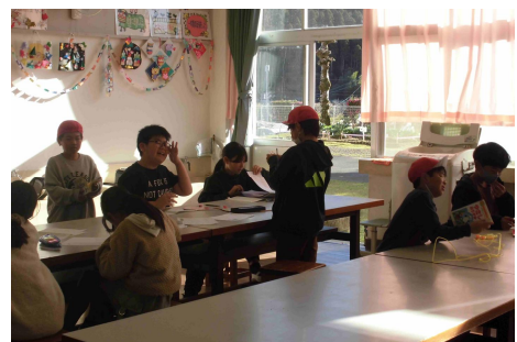
【おしゃべりもた～くさん】