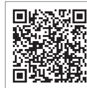
↑日南市まるぶく相談LINE