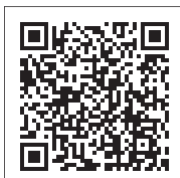
↑日南市まるごと相談LINE