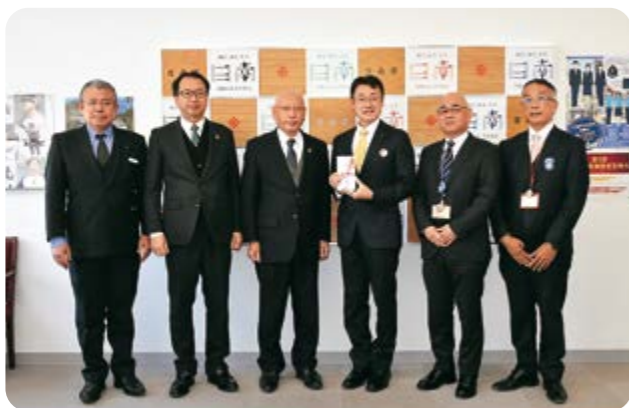
1/30 日南市役所 「JAはまゆう」からカーブミラーが寄贈されました

はまゆう農業協同組合から地域住民や農業者の交通安全を図ることを目的に、本市にカーブミラー6基が寄贈されました。寄贈式は日南市役所で行われ、蔵富組合長から西久保副市長に目録が手渡されました。寄贈されたカーブミラーは市道や農道などに設置されます。