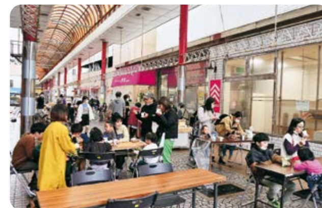
油津一番街商店街

食育活動の一環として、毎年恒例の餅つきが吾田小学校で行われ、5年生70人が参加しました。JAはまゆう職員・女性部、地域の方の協力のもと、きねと臼を用いて餅つきを体験。元気な掛け声とともに一生懸命ついたお餅をおいしそうに頬張っていました。