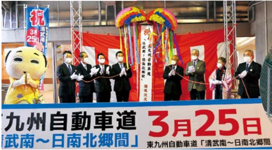
九州自動車道 3月25日 清武南～日南北郷間 東九州自動車道「清武南～日南北郷間」