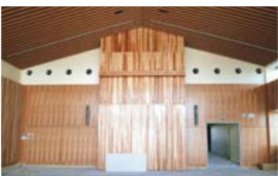
3階議場内装工事 (令和5年3月1日撮影) ※2月末時点の進捗率 工事全体94.24% 建築主体工事(1工区) 100%