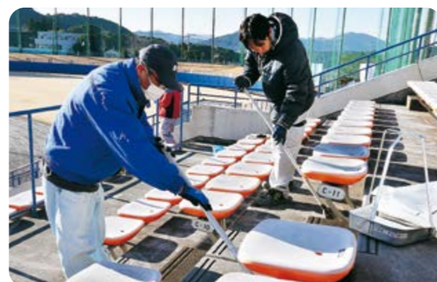
1/28 天福球場・南郷スタジアム キャンプを前に 球場をきれいに

瀬西区自治会が、広島東洋カーブの春季キャンプを盛り上げようと「ミニこいのぼり」の飾り付けを行いました。この日は、瀬西区住民や「ひなもり保育園」の園児など、およそ50人が参加。約500匹のミニこいのぼりを球場前の線路沿いや公民館周辺に設置しました。