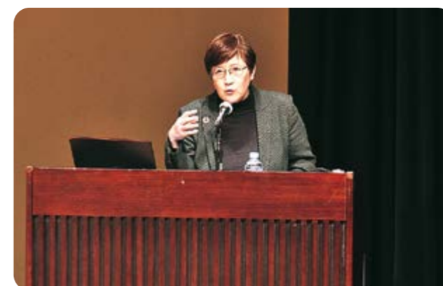
1/21 日南市文化センター 脱炭素社会の実現に向けて ゼロカーボンシティ推進講演会

明日の社会を築く子どもたちが、自分の考えていることや感じていることを発表する、第14回日南市「新春子どもの声を聴く会」を開催しました。市内小中学校から代表1人、計23人が登壇し、緊張しながらも、堂々とした表情で自分の思いを発表しました。