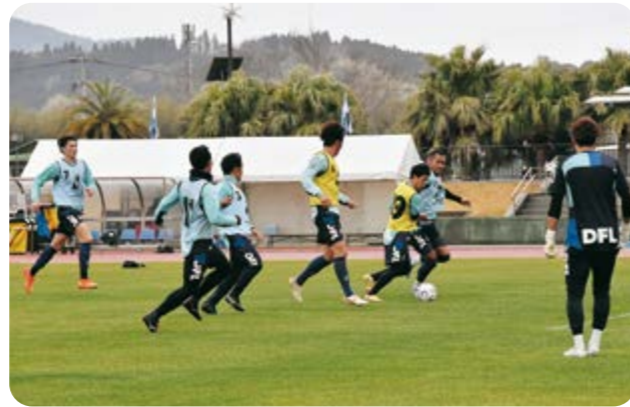
日南総合運動公園 陸上競技場

南郷町中央町で、毎年2月1日に五穀豊穡や無病息災を願ひ鶴戸神宮に奉納する「御供上げ米」用の俵編みがありました。同地区に300年以上続くこの伝統行事は、稲わらを手作業で編み、米俵2俵を作り、もち米を1俵に37.5キロ、計75キロを入れて奉納しています。