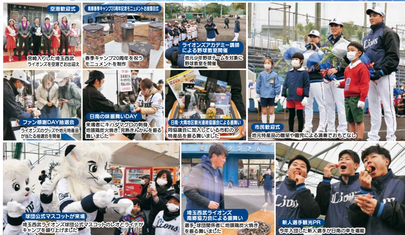
空港歓迎式 宮崎入りした埼玉西武ライオンズを空港でお出迎え