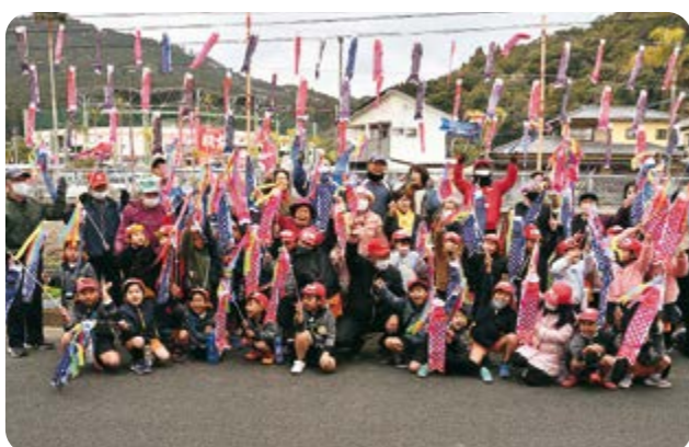
1/30 天福球場前 ミニこいのぼりでカーブを歓迎!

寒空の下、なんごうハートフルまつりが3年ぶりに開催されました。コロナ禍で中止となっていた祭りは、園児の和太鼓とマーチングの元気な演奏で開幕。歌謡ショーやお楽しみ抽選会、南郷の特産品販売などが催され、会場は訪れた人で活気に満ちあふれていました。