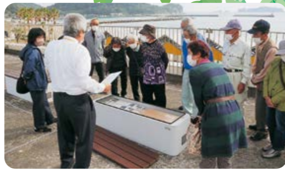
【大堂津津波緊急避難施設】

11月に第4回「地域めぐり」、1～2月に第5回「心に残る映画会」を開催しました。「地域めぐり」では、大堂津津波緊急避難施設と道の駅なんごうの見学を行いました。緊急避難施設では、屋上(高さ9.3m)のベンチに収納されている備蓄品や太陽光を利用した停電時の電源設備などを見学しました。また、道の駅なんごうでは、美しい景色を堪能しながら、向かい側に位置する大島の鞍埼灯台の概要や大島特有の動植物などについて説明を受けました。令和4年度最後の第5回「心に残る映画会」では、「認知症を共に生きる」をテーマにした映像を視聴し、認知症との向き合い方や高齢者の命の尊厳など、人権について考える機会となりました。さらに、日南市が作成した「迎撃視の事件ファイル」を視聴し、電話やパソコンを利用した巧妙な振り込め詐欺の状況やその防止方法などを学ぶことができました。