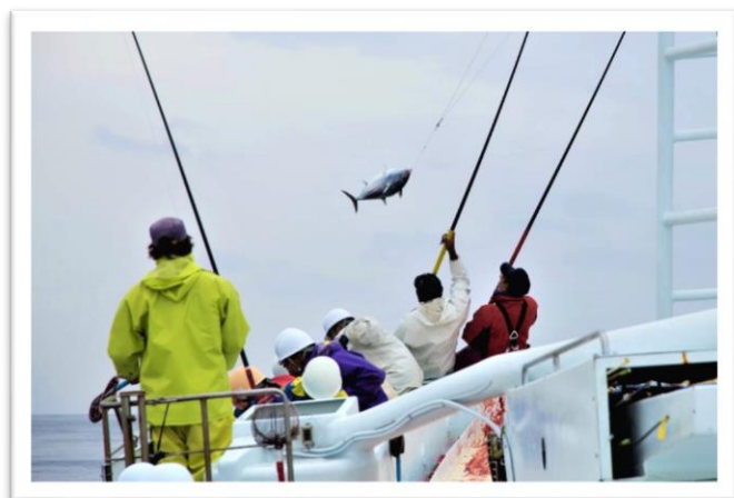
日南かつお一本釣り漁業