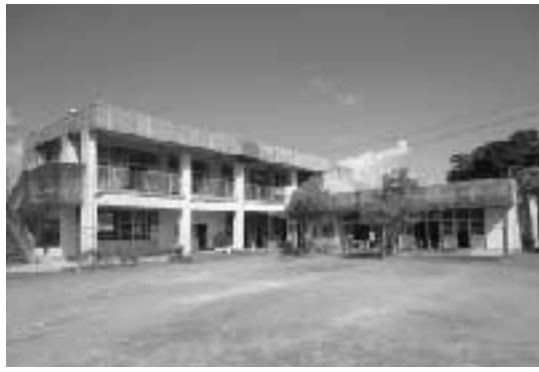
ファミリーサポートセンターが開設予定の桜ヶ丘保育所

働いている人が仕事と育児を両立できるように、地域全体で子育て家庭を支援し、安心して子どもを生み育てることが出来る環境づくりを推進するため、ファミリーサポートセンターの開設に向けた施設改修等を行うものです。