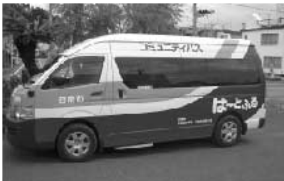
現在、南郷地域を隔日運行しているコミュニティバス（ハートフル号）

高齢者や児童等の交通手段を確保するため、南郷地域のコミュニティバス路線及び運行日程の見直しを行うものです。