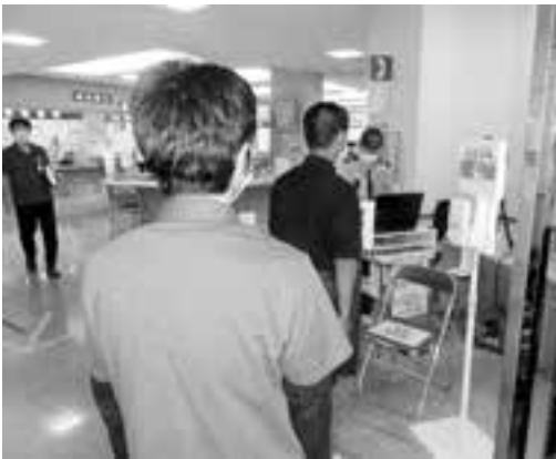
中部病院玄関前検温等業務のようす

保育所等における業務のICT化を推進し、子どもを安心して育てることができるよう、登降園システムやオンライン研修等が行える環境整備のため、機器導入に対する助成を行う経費です。