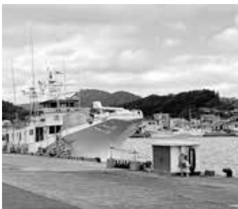
目井津港のかつお船