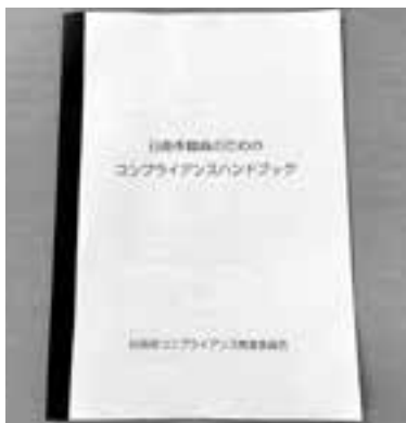
日南市職員のためのコンプライアンスハンドブック

のホームページに掲載を検討すると答弁があったが、その後どうなったのか。 答 市民に分かりやすい内容となるように、日南市教育支援委員会の方々の意見も参考にしながら進めていく予定。内容が決まり次第、ホームページに掲載する。