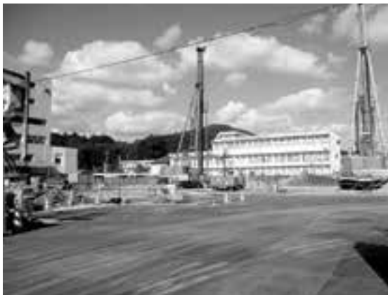
着々と進む新庁舎建設