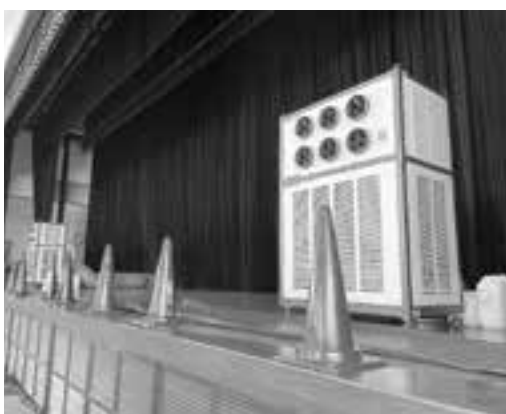
多目的体育館に配備された移動式エアコン