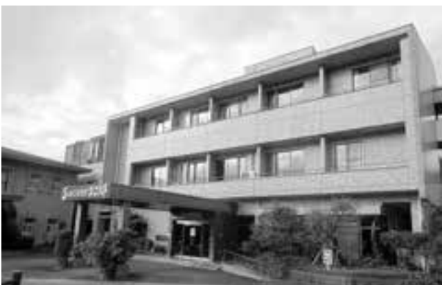
閉鎖中のサンチェリー北郷

か。 答 早期再開を望む多くの市民に伝えるため、国県の補助がなくても実施したいと考えている。