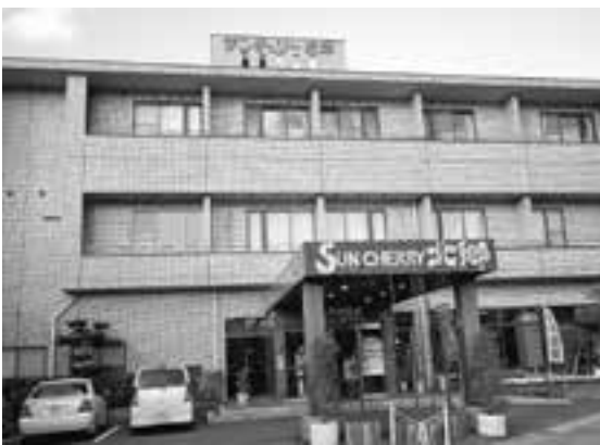
閉鎖中のサンチェリー北郷