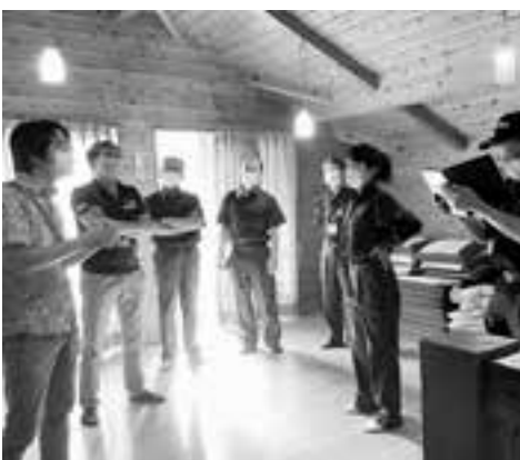
蜂之巣コテージ所管事務調査のようす

県の事業決定に伴う有害鳥獣対策協議会への補助金の追加及び果樹園等における有害鳥獣被害防止のために設置する侵入防止柵に係る経費です。