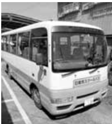
更新が必要な日南市スクールバス