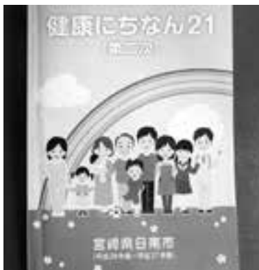
心の健康対策が記されている「健康にちなん21」