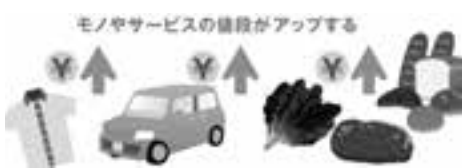
「電気料金」だけではない再エネの問題点

答 市内での副反応の情報を得ることは難しいので、国の情報があることの周知を図っていく。