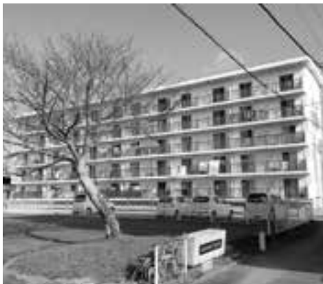
長寿命化が進む松原団地