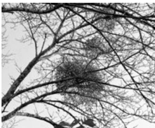
サクラてんぐ巣病