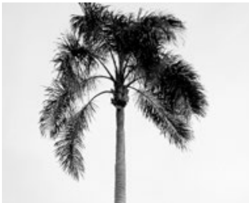
管理困難な高さのワシントンニアパーム