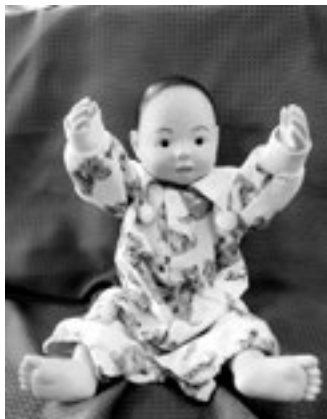
育児体験人形（しょうちゃん）