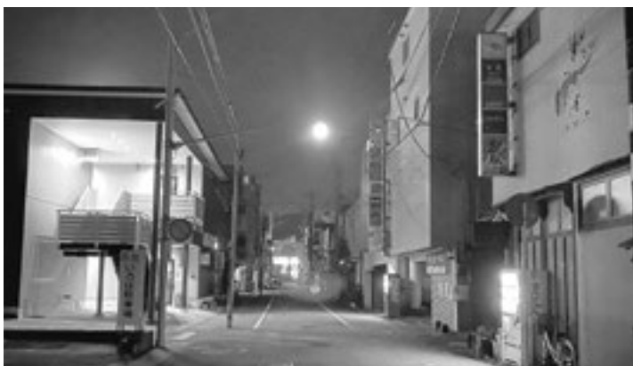
街灯がなく店舗の灯りだけで営業を続ける夜の街

て、未来の地元企業の成長に繋がって頂きたいが、企業投資等の考えはなにか問う。 答 現在では、企業の成長に関する支援として、企業誘致促進事業での雇用促進奨励金や情報サービス業への助成金などに充当している。今後も地元企業の成長に繋げるための投資は必要であるので、効果的に活用していく。