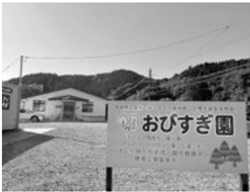
在園児を対象に日曜保育を行う企業主導型保育園

答 県の補助事業として償還払い方式が要件となっている。県の補助対象から外れると市の財政負担が大きくなることから、市単独での現物給付化は困難である。