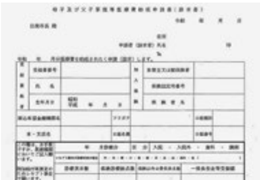
母子及び父子家庭等医療費助成申請書

答 国や県、交通事業者との協議を進めて、市民の利便性向上が図られる持続的な交通体系の構築に向けて検討していく。