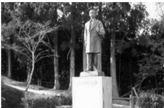
竹香園の小村寿太郎侯銅像

管理用地を市有地財産として受け取り、市が事業継続はできないか。 答 状況について話を伺う。 問 南郷町における防災行政無線屋外拡声子局の撤去について 答 防災無線の再配置はできないか。 答 必要性について検討する。 （仮称）道の駅北郷の運営について