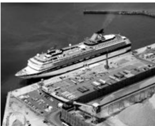
整備促進が急がれる油津港