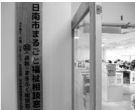
ご相談者に寄り添う「まるごと福祉相談窓口」

答 来年度に国が事業化を予定しており、そこから全国的に調査が行われることが見込まれる。国や県が行う実態調査の項目や結果を踏まえ