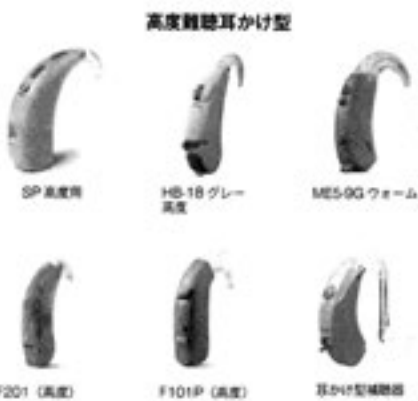
一般的な補聴器（耳かけ型）