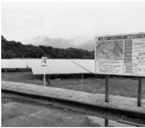
市内の太陽光発電施設

答 11月24日に二役と市内4漁協組合長とで意見交換を行った。操業を維持するための対策を様々な観点から検証し、支援を検討する。