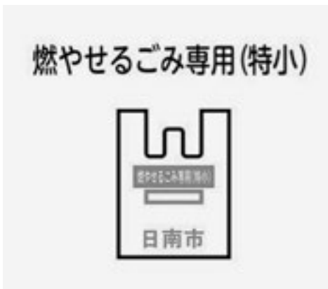
有料レジ袋として代用できないかな

問 書籍から得られる情報は知的な驚きや発見、創造性を刺激するものが豊富で、印刷された文字を理解する中で洞察力や意志力も磨かれる。読書を習慣づけるための取組を問う。