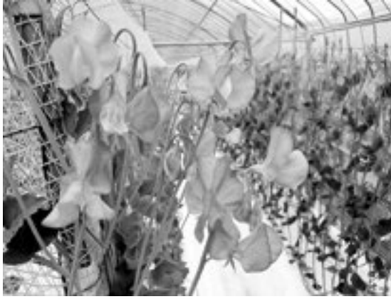
栽培中のスイートピー

コロナ禍で疲弊した市民を元気づけるとともに、スイートピーの認知度向上及び消費拡大を図るために実施する「スイートピー花まつり」に要する経費です。事業内容として、市内公共施設や市内金融機関等でのスイートピー展示等を予定しています。