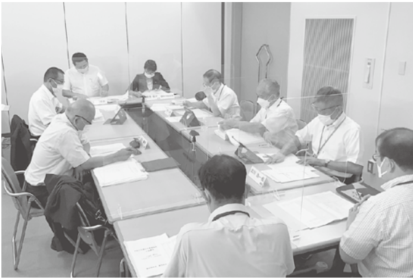
委員会審査のようす