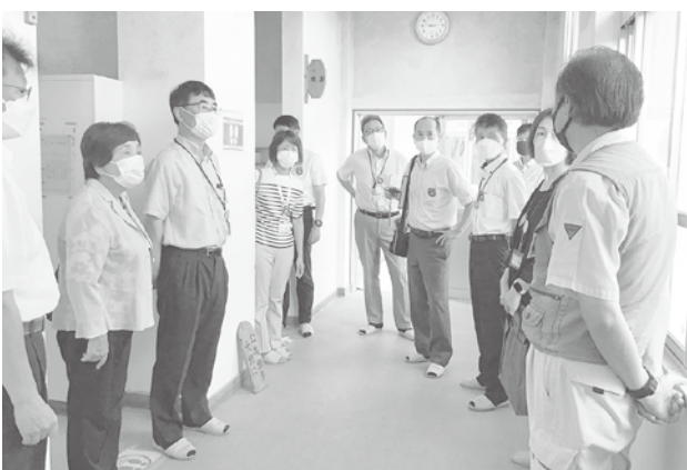
所管事務調査のようす