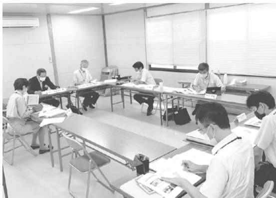
委員会審査のようす

答 本事業は30万円を上限に資材などの購入補助を行うものであるが、令和3年度は申請が16件と少なかった。