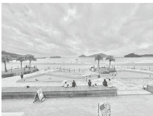
大堂津海水浴場の子どもプール

答 主要な避難所となる体育館は多目的体育館と、さくらアリーナがある。多目的体育館は建設当時に配管等の設備がなされているが建設から34年経過し使えるかどうか、まずは調査を実施したい。