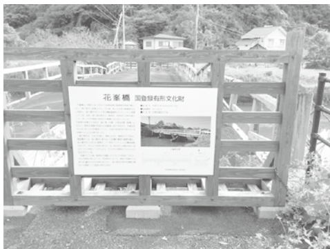
老朽化が進む現在の花峯橋

答 基金条例に基づき、堀川運河周辺の現況や課題も整理しながら関係課職員で検討している。今後、二役等を含め協議し、活用について整理を進める。