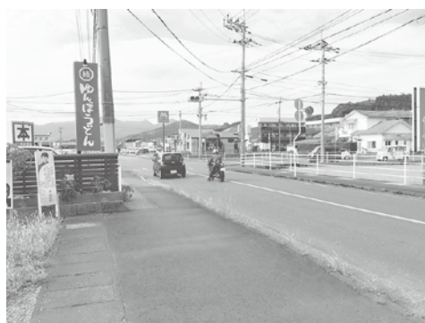
産業道路沿い田中書店付近 の交差点