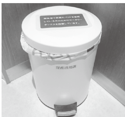
都城市本庁内に設置の サニタリーボックス