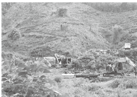
森林を伐採している様子

答 過酷な労働環境から慢性的な労働力不足となっており、森林整備担い手確保対策などに取り組んでいる。