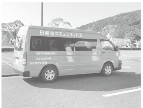
コミュニティバス ジャカランダ号