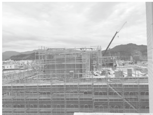
技師が減少している 土木・建築業界

問 串間市の上乗せ助成は、期間内限度額4万円である。日南保健所管内の対象者は、昨年は1人とい