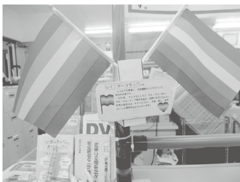
地域自治課窓口の レインボーフラッグ

問 パートナー宣誓証明カードを提示すると、市から受けられる行政サービスの取組状況を問う。