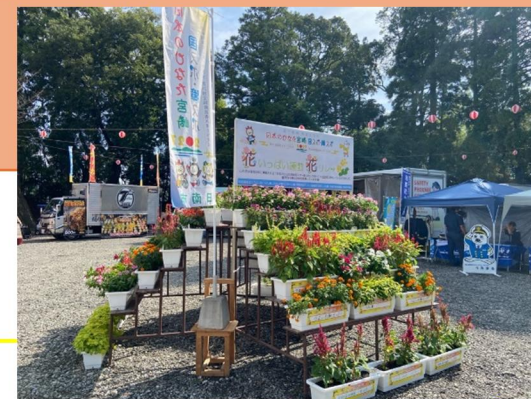
飫肥城下まつり会場