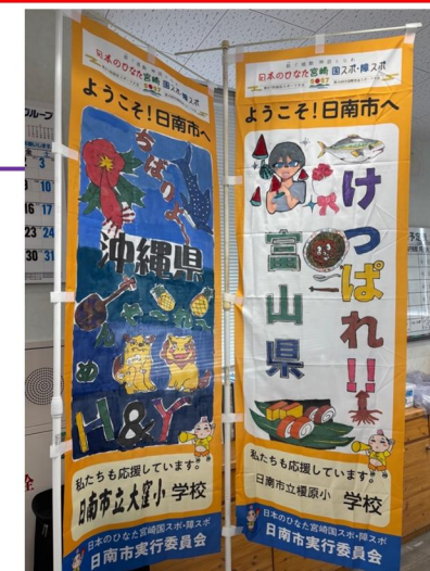
大窪小、榎原小学校作成分

令和8年度は5セット(235本)を残りの日南市内の全小学校(5・6年生)、中学校(私立を含む)に依頼予定