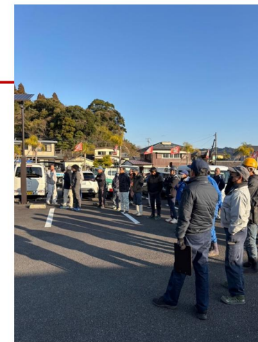
日南地区建設産業団体連合会による奉仕活動（天福球場）

日南市管内駅清掃、日南地区建設産業団体連合会奉仕活動等との連携（広報チラシとノベルティを配布）、リハ大会会場美化活動を実施予定