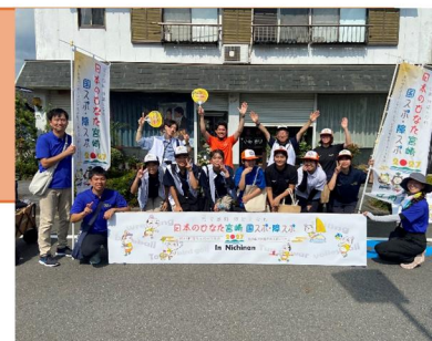
飫肥城下まつりパレード