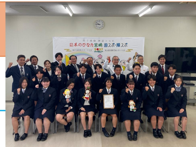
委嘱状交付式 （日南学園高校）

弁当メニュー作成の委嘱（日南学園）、本大会協力団体の募集（HP・市広報誌等での募集、実績のある関係団体への依頼）