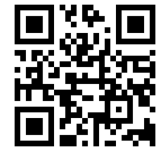
つうえんポータル

右記の二次元コードを読み込み、つうえんポータルにアクセスし、その画面にてお住まいの自治体を選択し、利用申請をしてください。