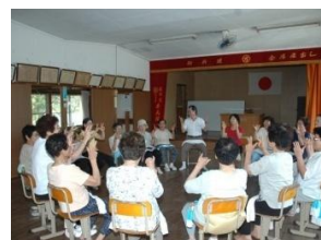
高齢者生活支援事業