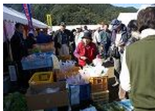
まちづくり支援事業