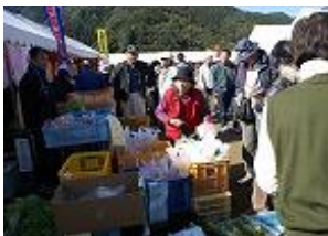
まちづくり支援事業