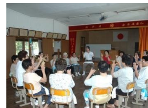
高齢者生活支援事業