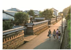
ふるさと活性化支援事業