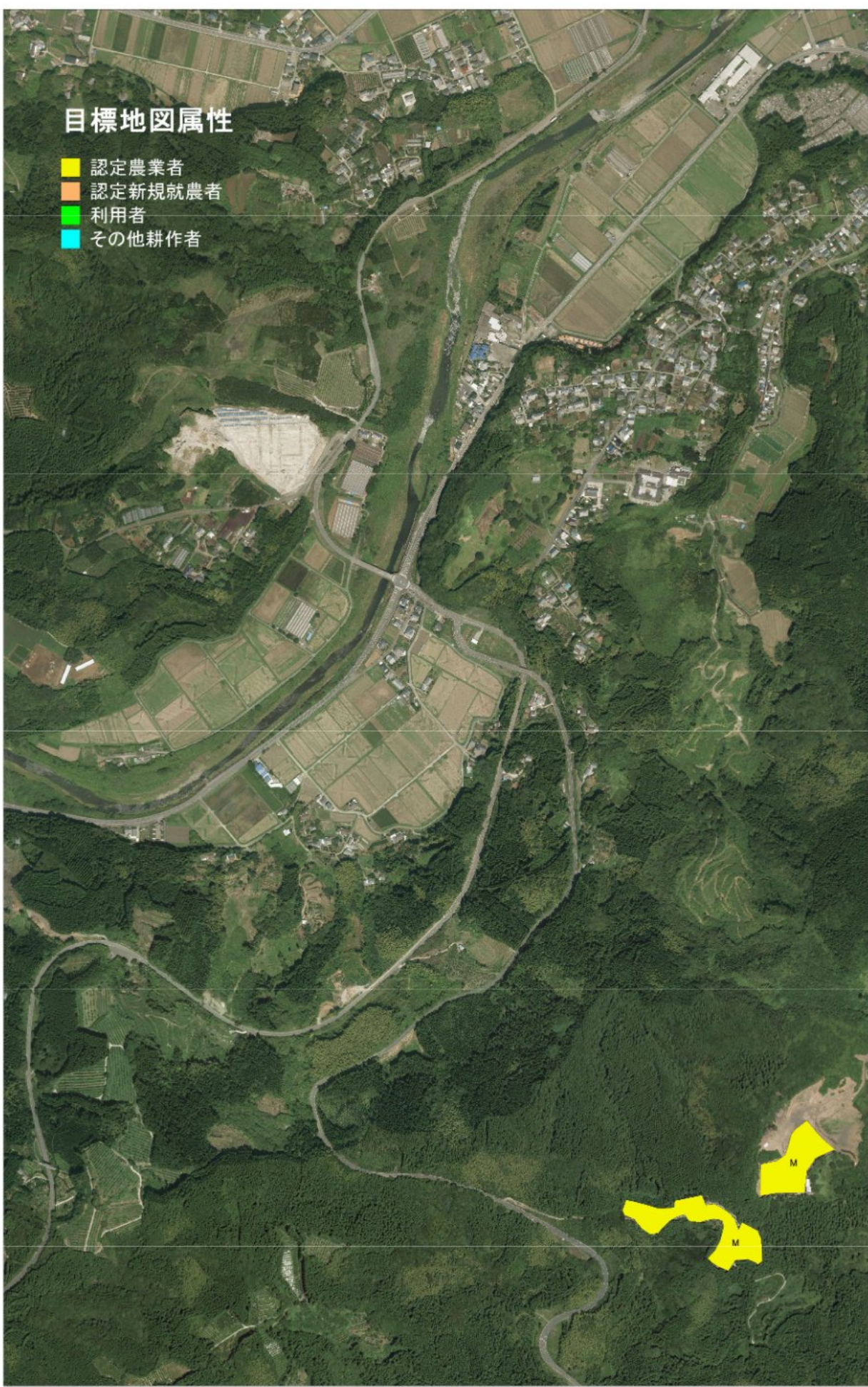
目標地図 (飼肥②) 【変更箇所】