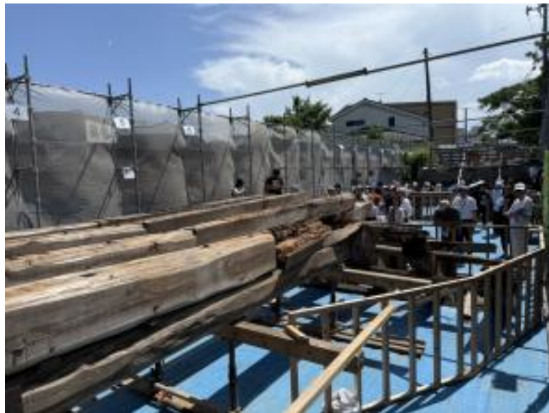
解体工事現場説明会 (R7.6月 )