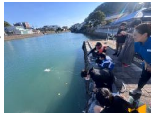
「②水中ドローンで学ぶ堀川運河」の様子