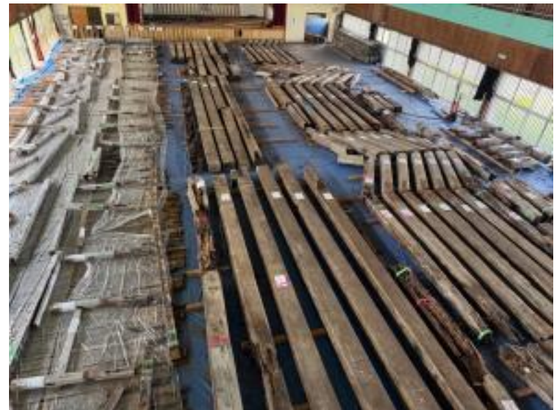
解体後の部材の保管の様子 (南郷中央体育館)