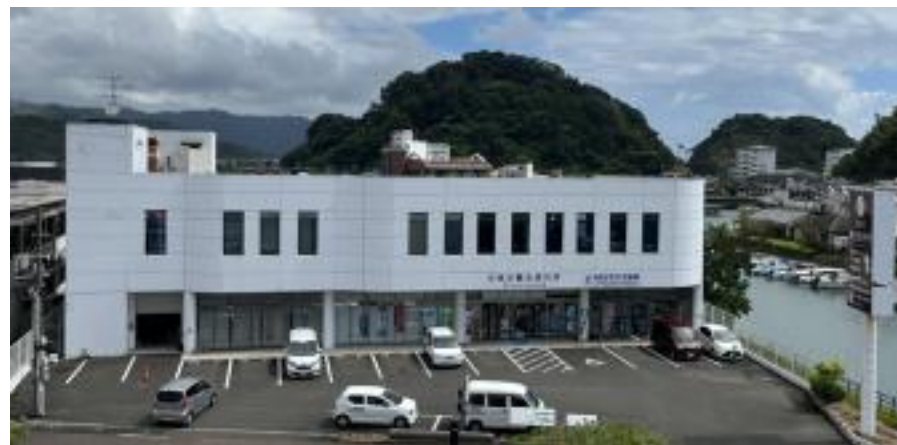
(改修前の日南市油津別館)

「歴史資料館」としての役割に重きを置きつつ、 地域への周遊を促すガイダンス機能も備えた施設へ 改修