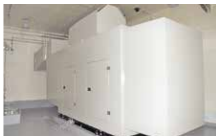
大規模災害発生時に 72 時間分の電力をまかなう発電機