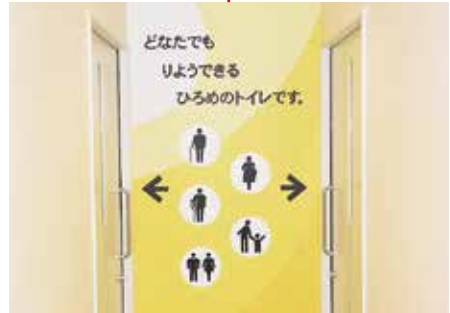
「だれでも利用できるトイレ」を示すサイン