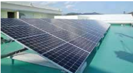
屋上階の太陽光パネル