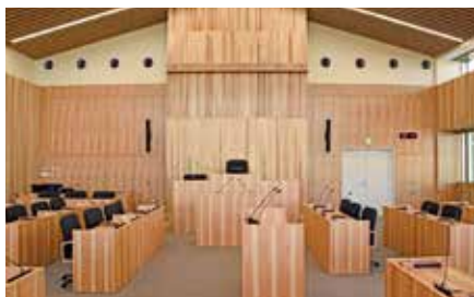
議場にも飢肥杉等の木材を使用