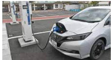
設置した急速充電設備2基 (車は市の電気自動車)