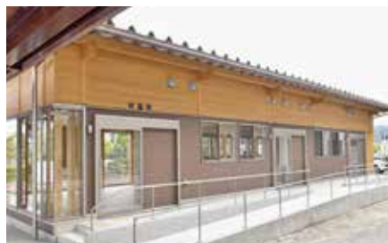
東京オリンピック・パラリンピックの選手村で使用された飢肥杉を一部使用した付属棟