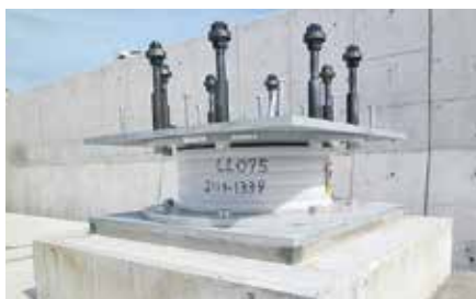
実際に設置した免震装置